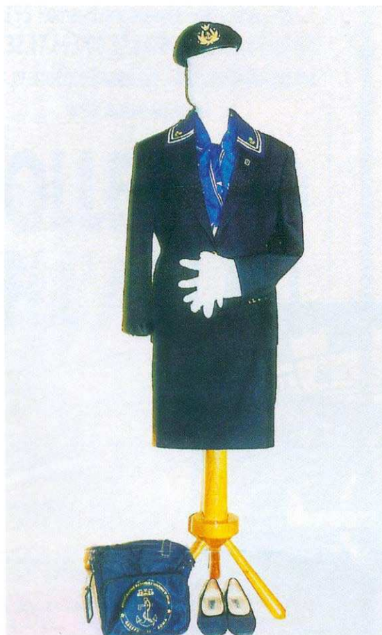
Allegato 6/A invernale