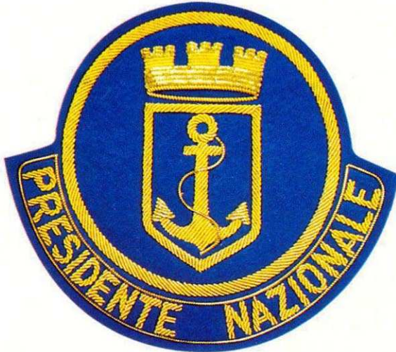
Tavola A - NAZIONALE