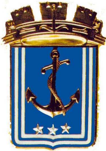
Tavola C - PATRONESSE