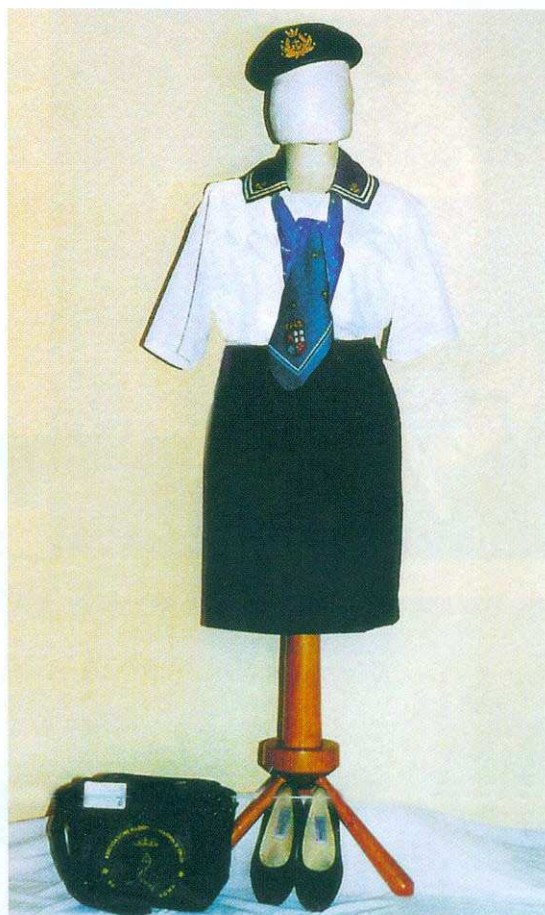
Allegato 6/B estiva