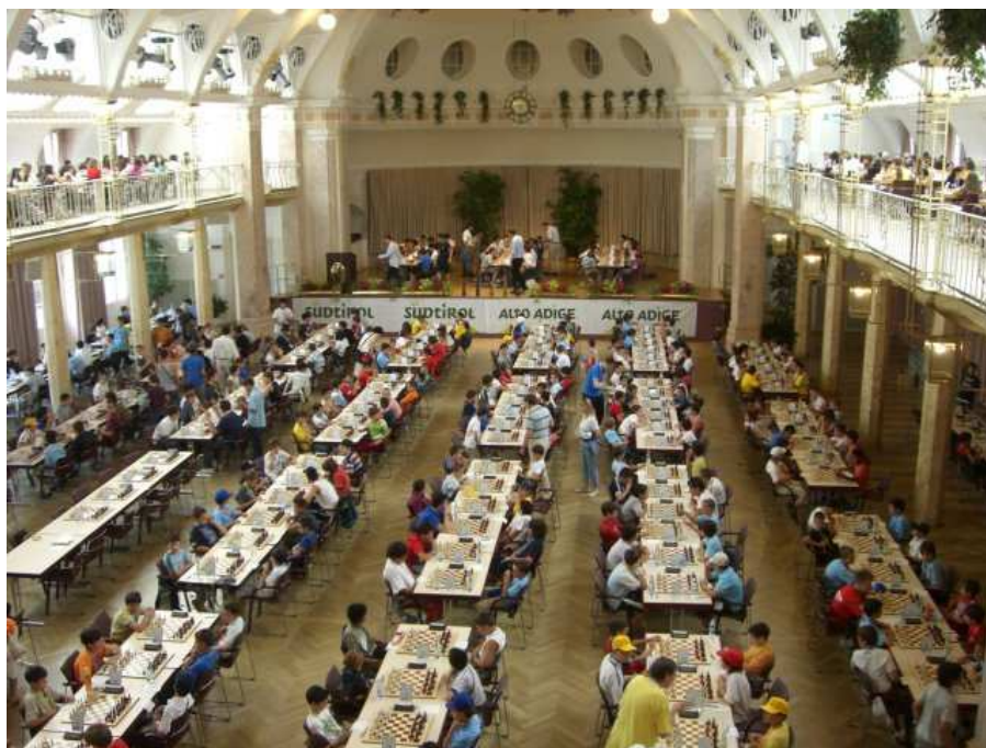
Panoramica della splendida sede di gioco dell'Hotel Kurhaus di Merano