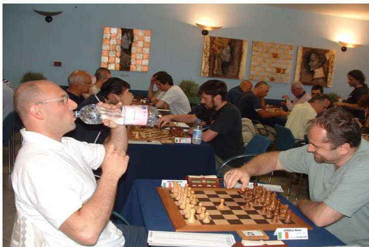
Derby emiliano-romagnolo in terra di Sardegna: Guido contro l'imolese Coralli