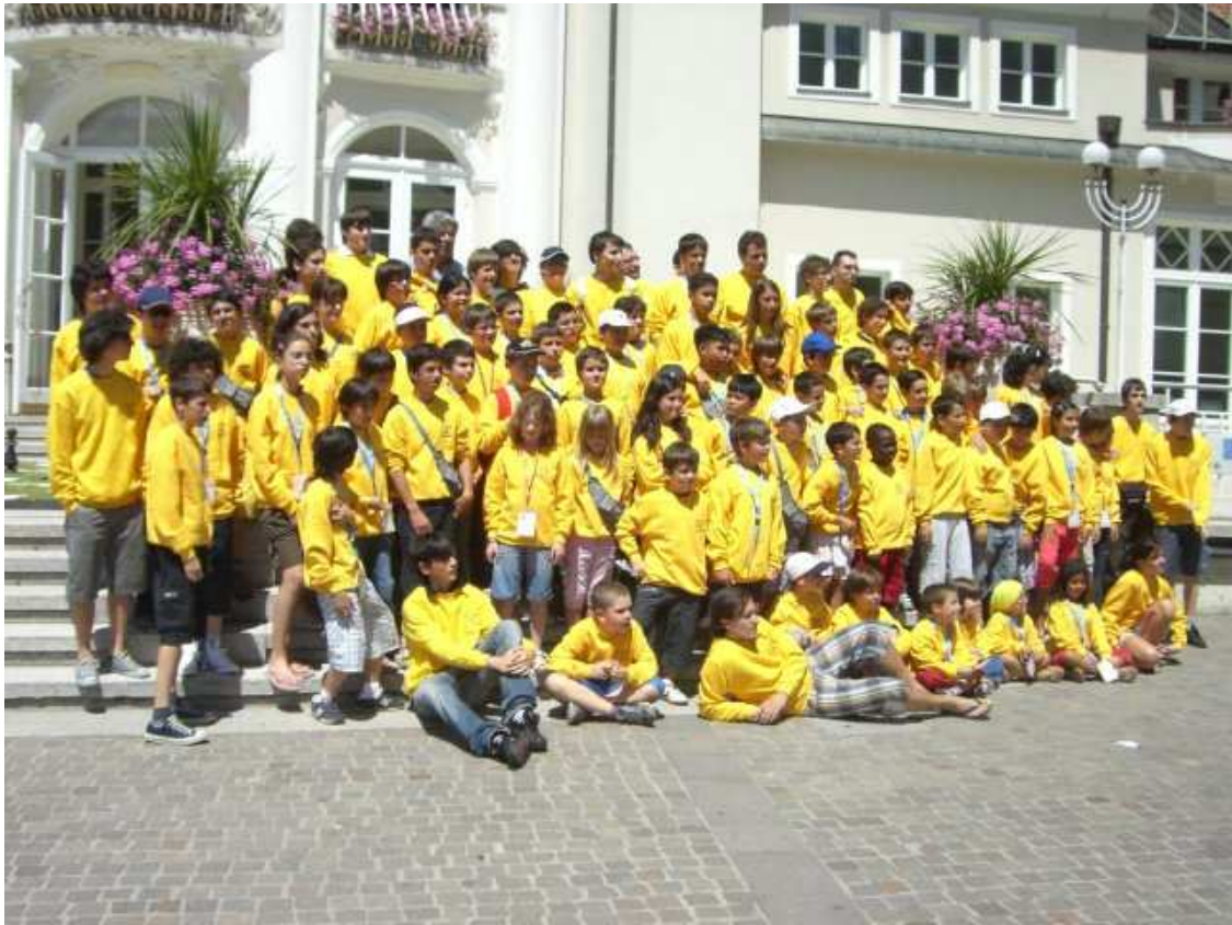
Foto di gruppo della compagine dell'Emilia Romagna, terza assoluta nella classifica per regioni