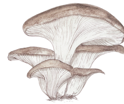
- ORECCHIONE - Pleurotus ostreatus