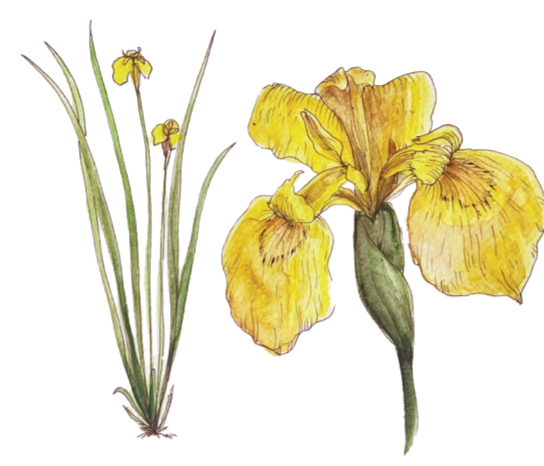
- IRIS PALUSTRE - Iris pseudacorus