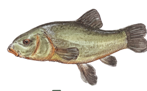
- TINCA - Tinca tinca