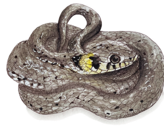
- NATRICE DAL COLLARE - Natrix helvetica