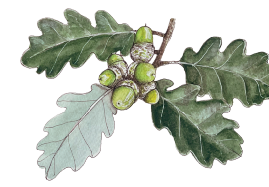
- ROVERELLA - Quercus pubescens