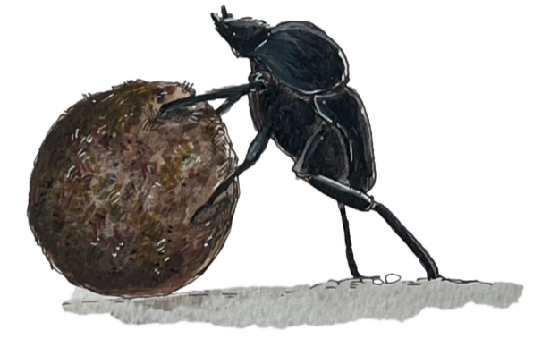
- SCARABEO DELLE SPIAGGE - Scarabaeus semipunctatus