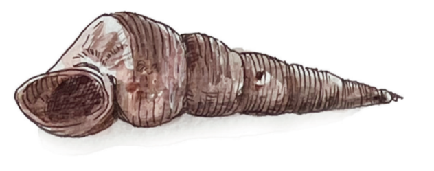
- TURRITELLA - Turritella communis