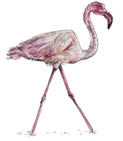
- FENICOTTERO ROSA - Phoenicopterus roseus