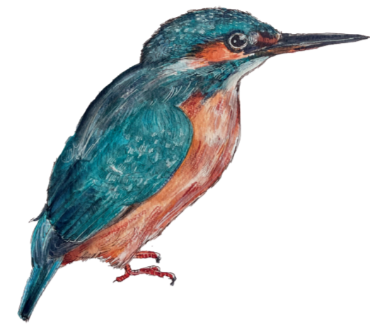
- MARTIN PESCATORE - Alcedo atthis