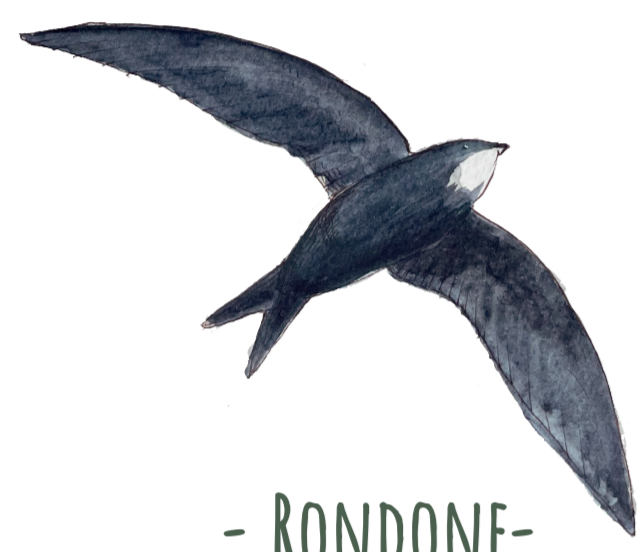
- RONDONE - Apus apus