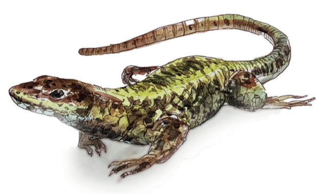
- LUCERTOLA MURAIOLA - Podarcis muralis