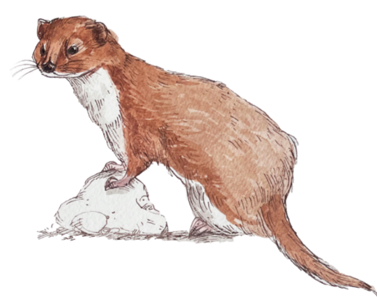
- DONNOLA - Mustela nivalis