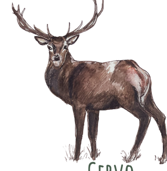
- CERVO - Cervus elaphus