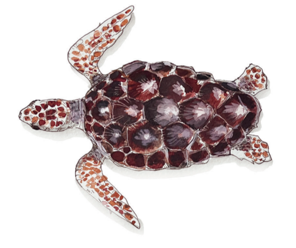
- TARTARUGA MARINA - Caretta caretta