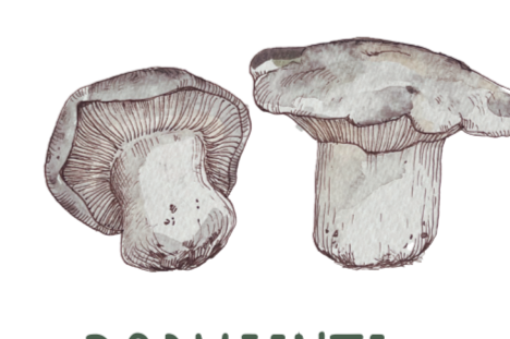
- DORMIENTE - Hygrophorus marzuolus