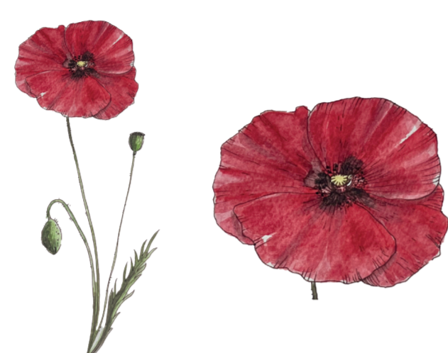
- PAPAVERO - Papaver rhoeas