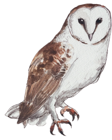
- BARGIANNI - Tyto alba