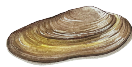
- UNIONE - Unio elongatulus