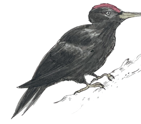
- PICCHIO NERO - Dryocopus martius