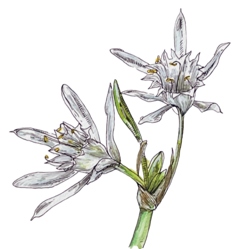
- GIGLIO MARINO - Pancreatium maritimum