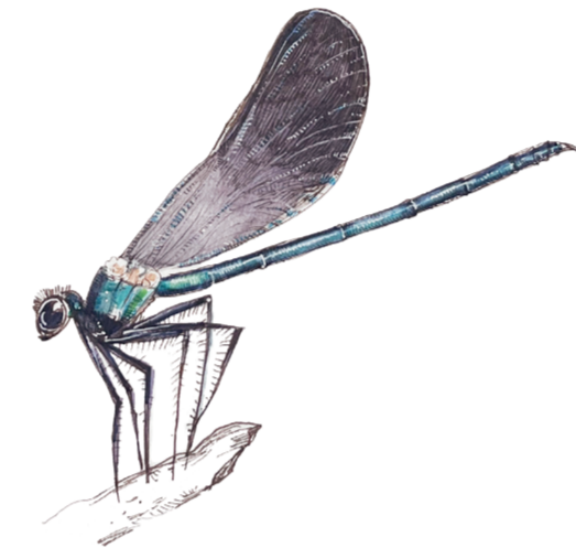
- SPLENDEnte COMUNE - Calopteryx splendens