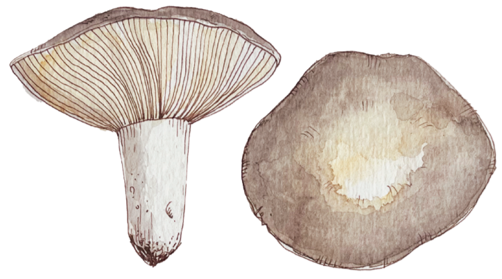
- BALUTA GRIGIA - Russula ochrospora