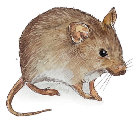
- TOPOLINO DELLE CASE - Mus musculus