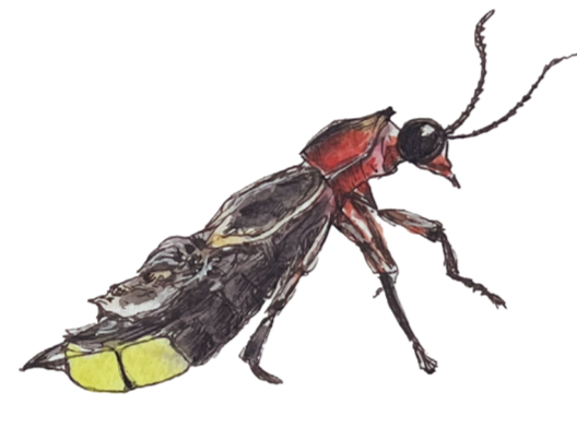
- LUCCIOLA - Luciola italica