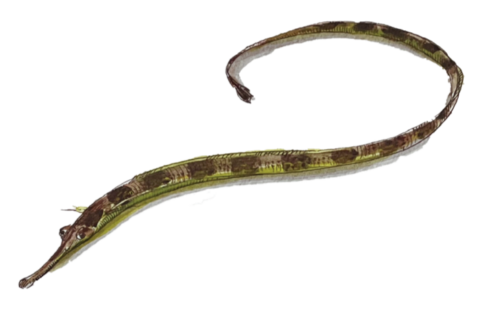
- PESCE AGO - Syngnathus acus