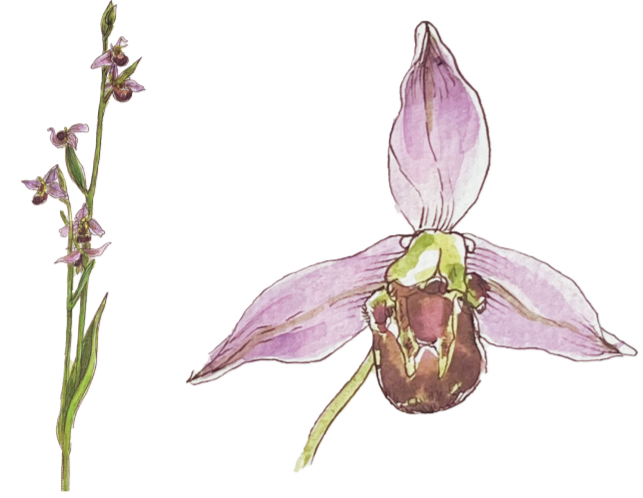
- OFRIDE FIOR D'APE - Ophrys apifera