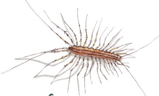
- SCUTIGERA - Scutigera coleoptrata