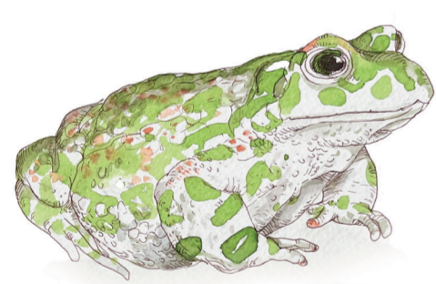
- ROSPO SMERALDINO - Bufo viridis