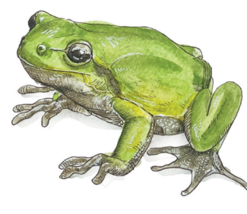
- RAGANELLA - Hyla intermedia