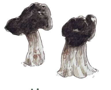
- URCELA - Helvella juniperi