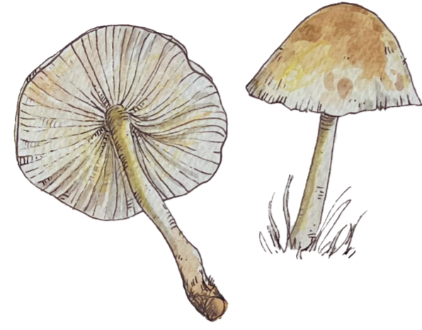
- GAMBESECHE - Marasmius oreades