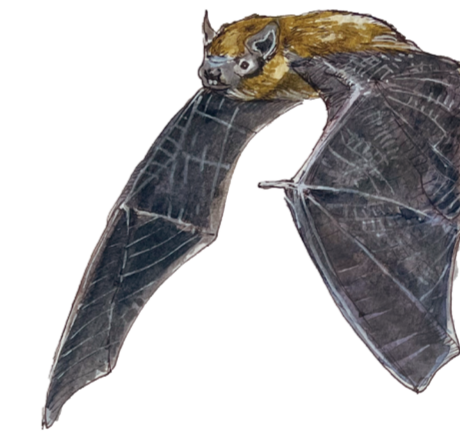
- NOTTOLA - Nyctalus noctula