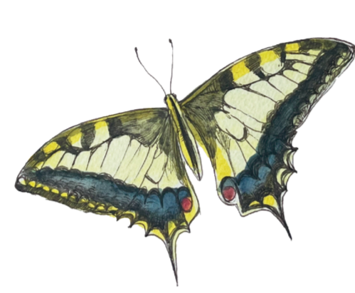
- MACAONE - Papilio machaon