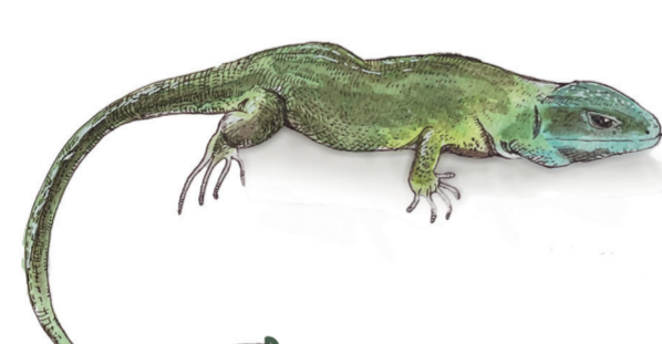
- RAMARRO - Lacerta bilineata