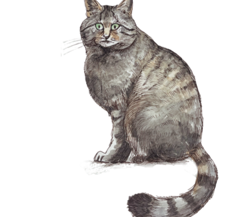
- GATTO SELVATICO - Felis silvestris